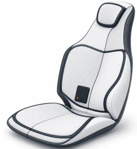
CS2 – Smart Seat