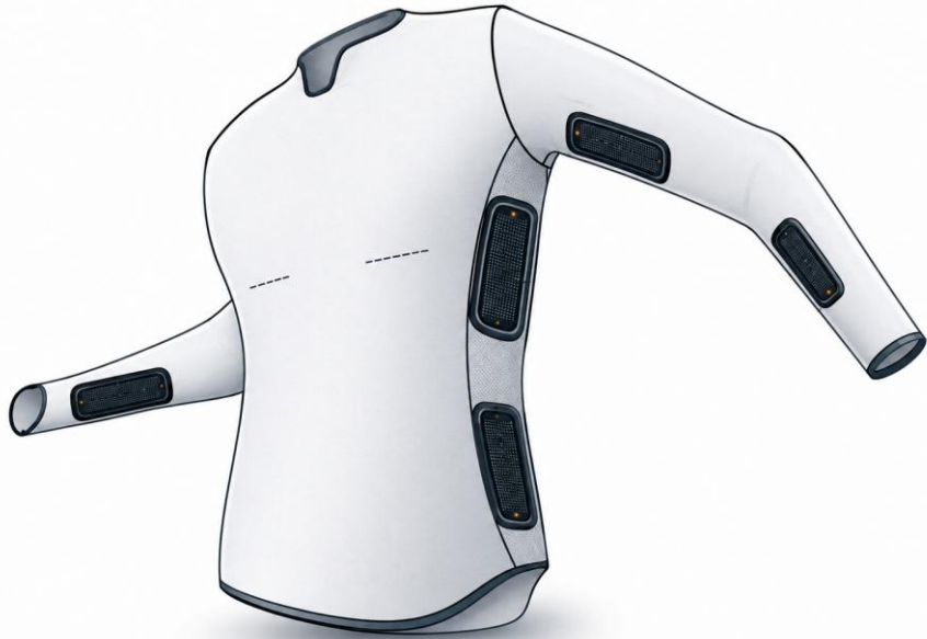
CS1A – Smart clothing (T-shirt)

Für den Bereich Smart Textiles gibt es 3 Use Cases