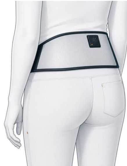
CS1B – Smart belt (gait monitoring)